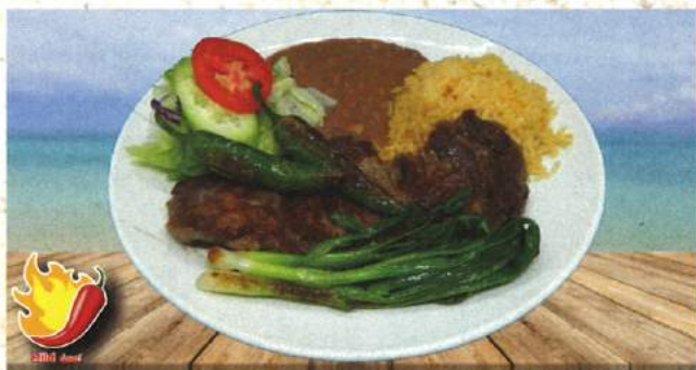
Rib Eye acompañado con cebollita verde y jalapeño toreado CARNE ASADA (RIB EYE) 21.52