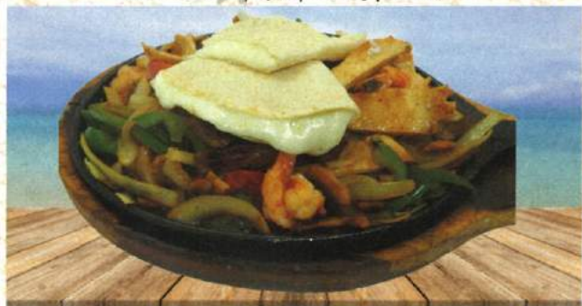
Carne a su elección a la plancha, jalapeño, hongos, cebolla, jitomate y un toque de sazón de la casa.

Servidas con arroz, frijoles, tortillas y quesadilla