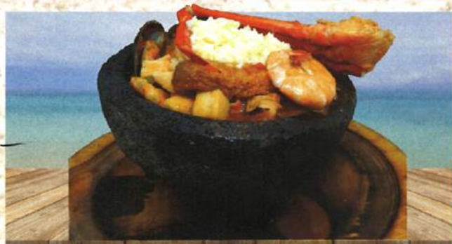
Camarón, pescado frito, pata de jaiba, conchas, jaiba imitación, abulón, callo y pulpo, guisado con cebolla, tomate, chile campana, un toque de salsa diablo y queso Monterrey.