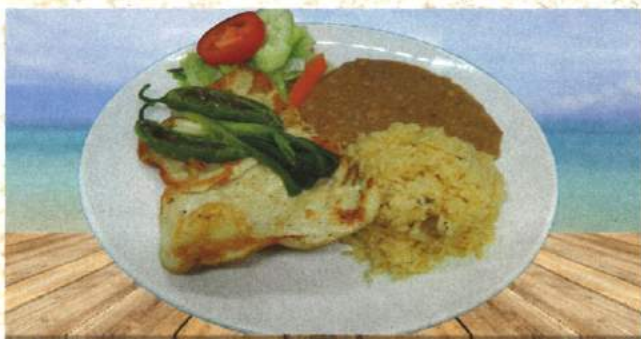
Pechuga de pollo asada en la plancha acompañada con cebollitas verdes y jalapeños PECHUGA A LA PARRILLA 17.93