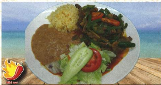
Carne de res guisada con cebolla, chile campana, rajas de jalapeño, jitomate, un toque de cilantro y un toque de diablo BISTEK RANCHERO (RIB EYE) 23.31