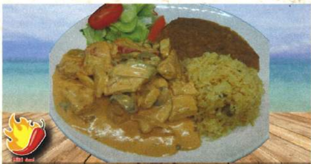
Pechuga de pollo guisada con tomate, cebolla, chile campana, chile jalapeño y hongos, con un toque de salsa diablo y crema. POLLO CON CREMA 19.98