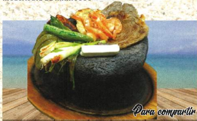
Servido con nopal, queso, chiles toreados, cebollitas verdes, chorizo y salsa de molcajete